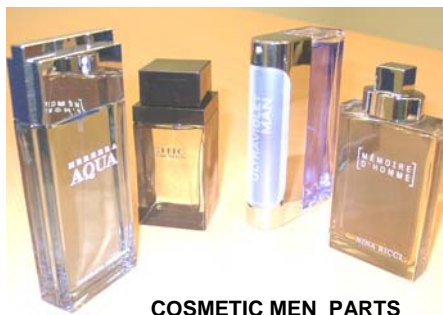
COSMETIC MEN PARTS