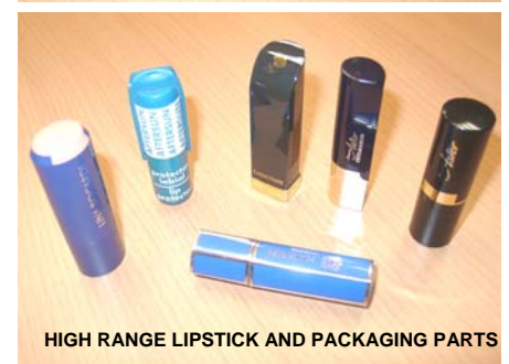
HIGH RANGE LIPSTICK AND PACKAGING PARTS