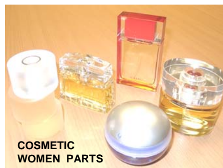
COSMETIC WOMEN PARTS